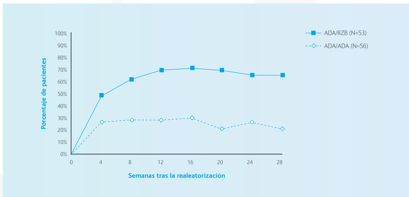
Figura 2: Evolución temporal de PASI 90 tras la reasestorización en el estudio IMMVENT

ADA/ADA: pacientes aleatorizados a adalimumab que continuaron con adalimumab.